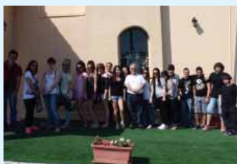
Εκδρομή των μαθητών στο Μουσείο Κέρινων Ομοιωμάτων «Φάτσα» στη Σκαρίνου