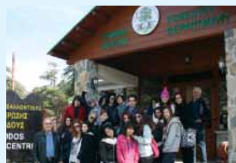
Εκδρομή των μαθητών στο Κέντρο Περιβαλλοντικής Εκπαίδευσης στο Τρόδος