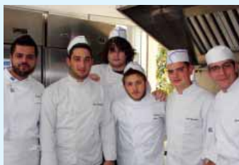
Οι μαθητές του Κλάδου Ξενοδοχειακών Σπουδών στο εργαστήριο Μαγειρικής & Ζαχαροπλαστικής