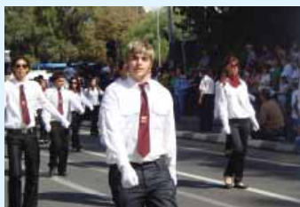
Οι μαθητές/τριες του Ι.Ε.Λ. Κ.Ε.Σ. τίμησαν τις εθνικές επετείες της 28ης Οκτωβρίου και 25ης Μαρτίου λαμβάνοντας μέρος στις καθιερωμένες μαθητικές παρελάσεις