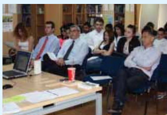
Οι μαθητές του Ι.Ε.Λ. Κ.Ε.Σ. παρακολούθησαν διάλεξη με θέμα το κάπνισμα και τις βλαβερές συνέπειές του στον ανθρώπινο οργανισμό